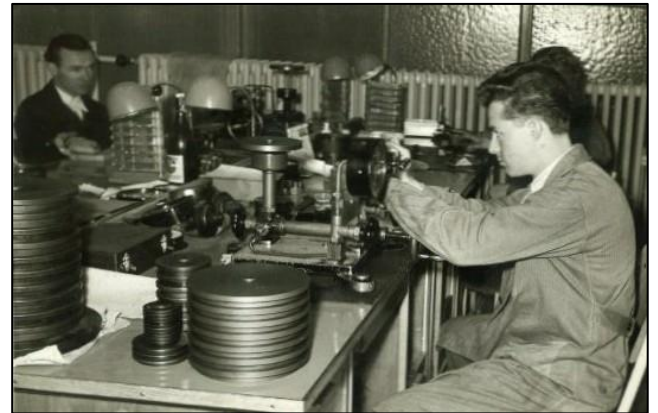
In der VOEST bei der Reparatur von Druckmessgeräten